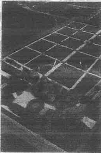
Wizualizacja cmentarza komunalnego w Długiej Kościelnej

Wsparcie naszych Ochotniczych Straży Pożarnych w realizacji ich zadań poprzez wyposażania jednostek i podniesienie jakości gotowości bojowej, co zwiększy bezpieczeństwo mieszkańców.